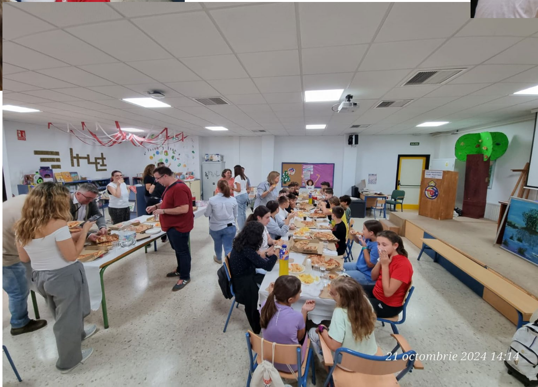
21 octombrie 2024 14:14