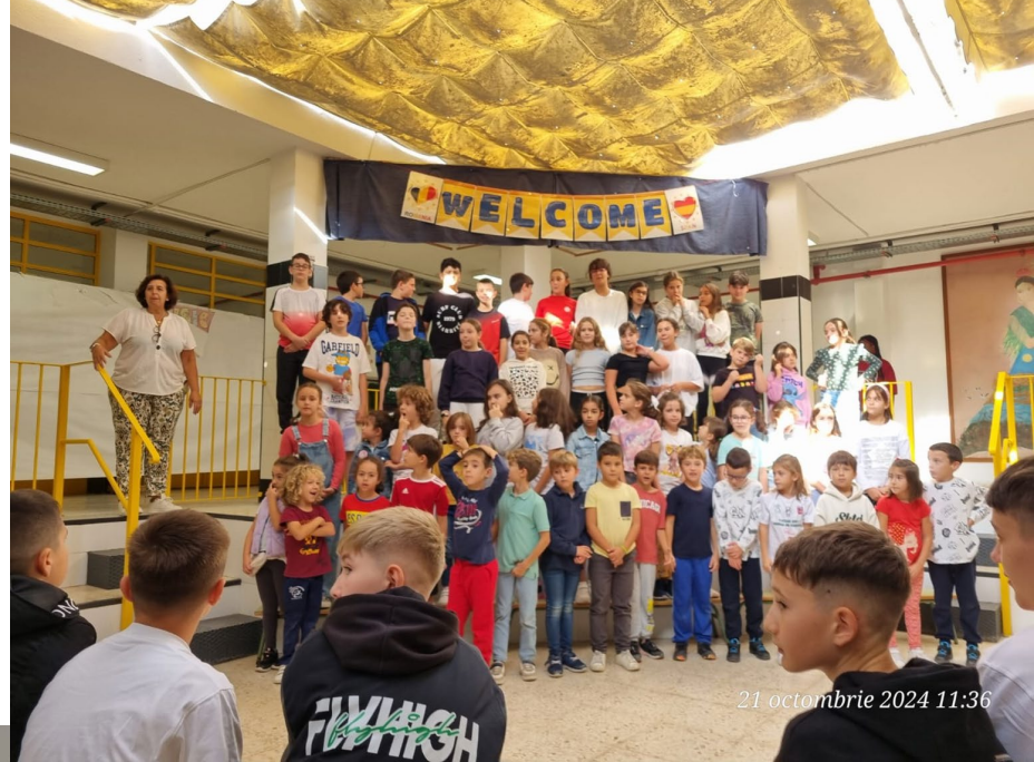
21 octombrie 2024 11:36