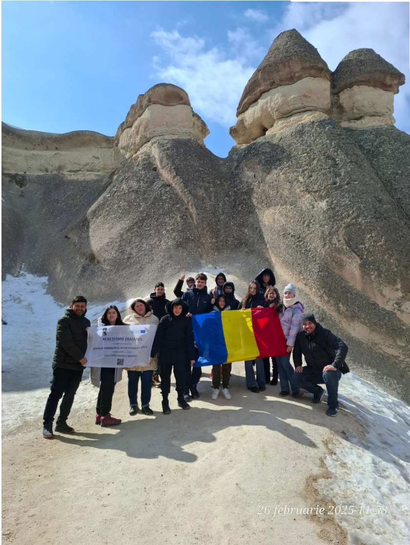
26 februarie 2025 11:58