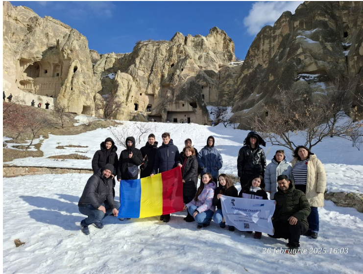
26 februarie 2025 16:03