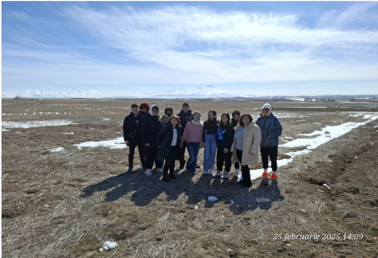
25 februarie 2025 14:09