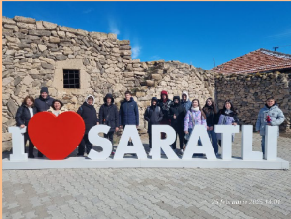
Orașul subteran din Saratli